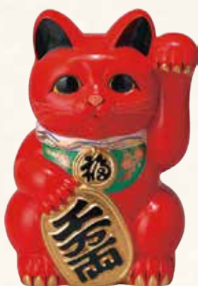
赤小判猫(左手) ¥43-05 6,500円 6号 13.5×12.5×H19 (税抜) ¥43-06 12,000円 8号 18×16×H25 (税抜) ¥43-07 21,000円 10号 23.5×22×H33 (税抜)