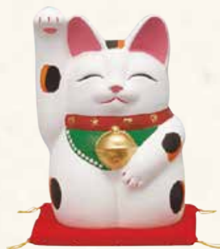
手描き 金運来福 萬助猫(右手) 赤座ぶとん付 ¥41-03 6,300 円 横幅cm×奥行cm×高さcm (税抜) 5号 11×11×H17