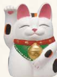
手描き 金運来福 萬助猫(右手) ¥41-05 3,700 円 横幅cm×奥行cm×高さcm (税抜) 3号 7×7×H10