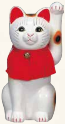
細猫(白) キ45-20 8,600円 (税抜) 8号 14×14×H26