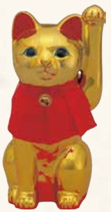
細猫(金) キ45-19 18,000円 (税抜) 8号 14×14×H25