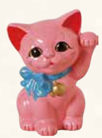
リボン猫(さくら) キ45-12 4,900円 (税抜) 5号 11.5×11×H15.5