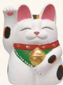
手描き 金運来福 萬助猫(右手) ¥41-04 4,500 円 横幅cm×奥行cm×高さcm (税抜) 4号 9×9×H11.5