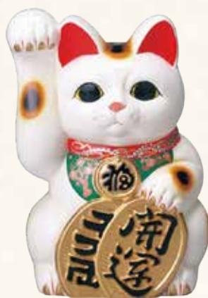
開運白手長小判猫(右手) ¥43-11 18,000円 10号 23.5×22×H35 (税抜) ¥43-12 34,000円 13号 28×27×H43 (税抜) ¥43-13 59,000円 15号 32×31.5×H48 (税抜)