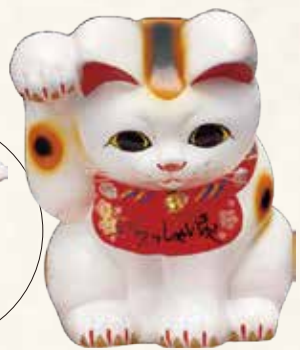
おじぎ猫 キ45-13 12,000円 (税抜) 白 8号 17.5×21×H25