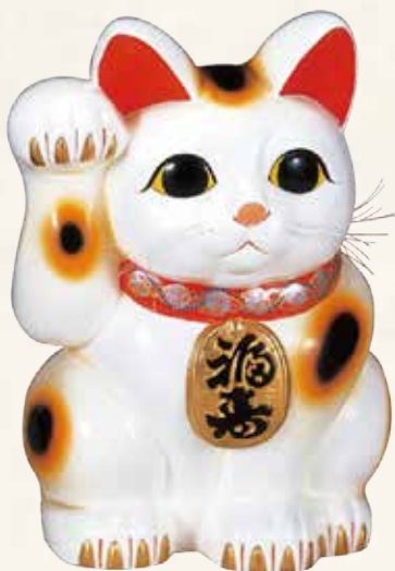
白福猫(右手) 横幅cm×奥行cm×高さcm ¥43-01 190,000円 20号 45×45×H63 (税抜)