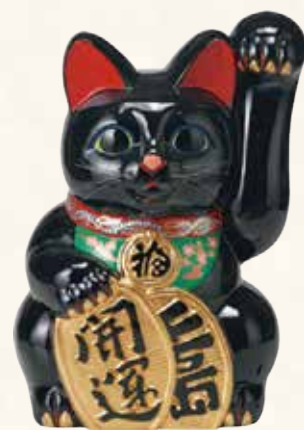
開運黒手長小判猫(左手) ¥43-17 22,000円 10号 23.5×22×H35 (税抜) ¥43-18 44,000円 13号 28×27×H43 (税抜) ¥43-19 76,000円 15号 32×31.5×H48 (税抜)