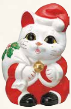
サンタ猫 キ45-14 8,200円 (税抜) 白 6号 13×12×H19