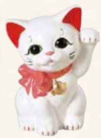
リボン猫(白) キ45-10 4,900円 (税抜) 5号 11.5×11×H15.5