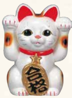
合格猫 キ45-16 4,500円 (税抜) 白 5号 12.5×10×H16