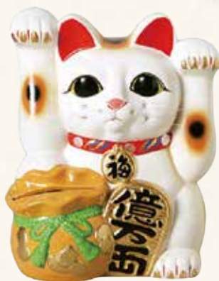
両手上げ宝当猫 ¥43-23 13,000円 8号 20×16.5×H25.5 (税抜)