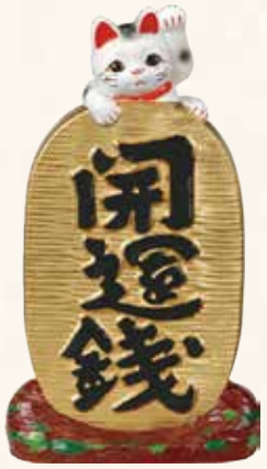
開運猫 キ45-18 10,000円 (税抜) 白 8号 14.5×7×H27