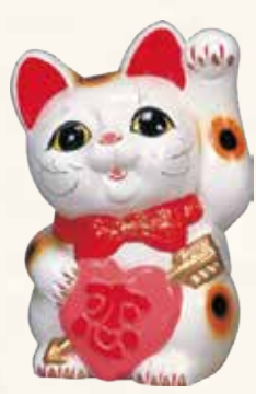
恋猫 キ45-15 6,000円 (税抜) 白 6号 14×12×H19