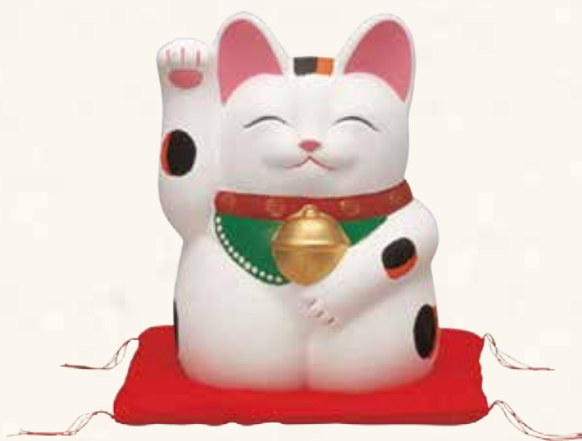
手描き 金運来福 萬助猫(右手) 赤座ぶとん付 ¥41-01 13,000 円 横幅cm×奥行cm×高さcm (税抜) 7号 15×14×H21

招き猫のふるさと常滑から生まれた 新しい形の招き猫、「萬助猫」。 福々としたフォルムに優しい笑顔。 鈴なりに金運をもたらしてくれそうな大きな鈴。 デザインはこの道60年の常滑焼原型師・伊奈武八氏。