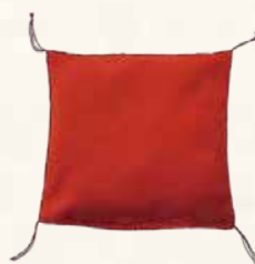
座ぶとん(ウレタン) ¥43-25 1,200円 4号 9×9 (税抜) ¥43-26 1,500円 5号 12×12 (税抜) ¥43-27 1,850円 6号 17×15 (税抜)