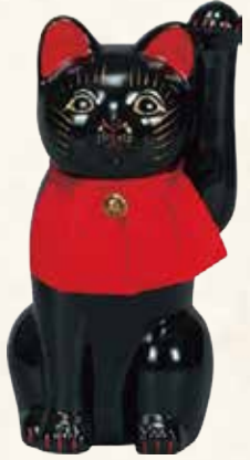
細猫(黒) キ45-21 12,000円 (税抜) 8号 14×14×H26