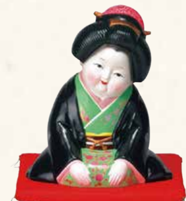
お福さん ¥43-24 24,000円 10号 24×24×H30 (税抜)