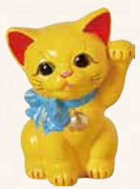
リボン猫(黄) キ45-11 4,900円 (税抜) 5号 11.5×11×H15.5