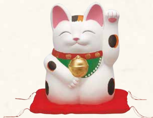
手描き 千客万来 萬助猫(左手) 赤座ぶとん付 ¥41-02 13,000 円 横幅cm×奥行cm×高さcm (税抜) 7号 15×14×H21