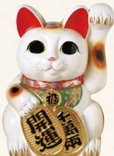
開運白手長小判猫(左手) ¥43-03 210,000円 20号 45×46×H63 (税抜)