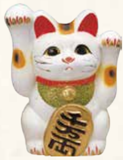
両手福招猫 キ45-17 4,500円 (税抜) 白 5号 12×9.5×H16